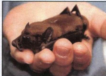
Großer Abendsegler Liebt Spalten in hohen Gebäuden