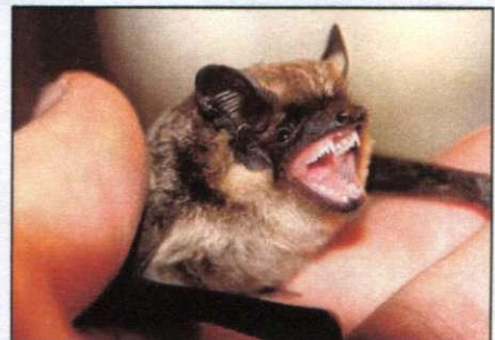
Zweifarbflieger hält sich gerne in Spaltenquartieren auf