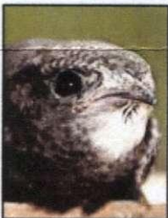
Mauersegler: Sie brüten gerne in dunklen Bereichen, die sie durch schmale Spalten zwischen Vordach und Mauerwerk finden. Alljährlich kehren sie an ihren Brutplatz zurück, bis zu 20 Jahre lang.