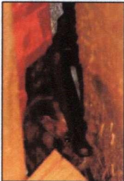
Großes Mausohr wohnt gern im Speicher

Eine nur ca. 5gr. leichte Zwergfledermaus vertilgt bis zu 50000 Mücken pro Jahr.